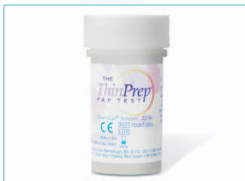
ThinPrep® Pap Test™